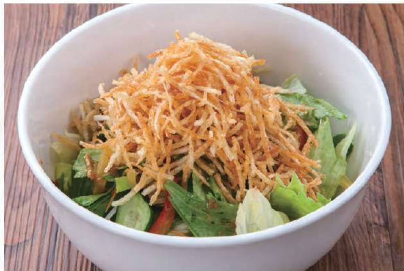
ICHI式沙拉 / Crispy Salad

カリカリサラダ ..... 800円(880円税込) (1人前) 280円(308円税込)