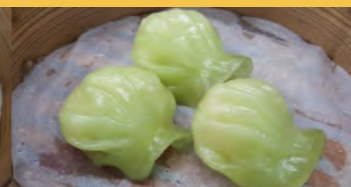
650 ひすい餃子 (1個)