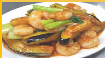
619 海老と茄子のピリ辛炒め