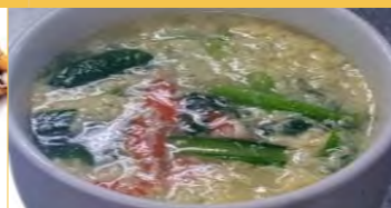
641 卵スープ (2~3人前)