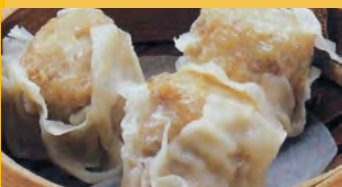
646 焼売 (1個)