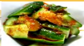
604 きゅうりキムチ風