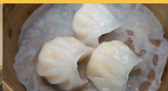
649 エビ蒸し餃子 (1個)