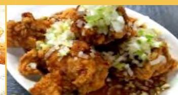
630 鶏の唐揚げネギソース