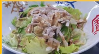
601 バンバンチーサラダ