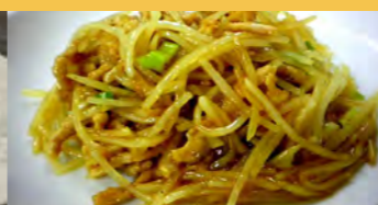
633 豚肉とジャガイモのカレー炒め