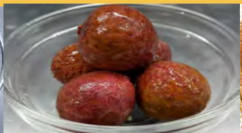
671 ライチ (5個)