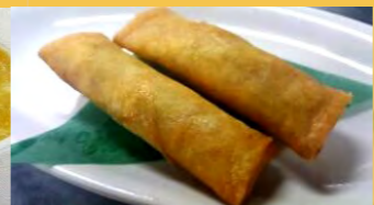
643 春巻 (1本)