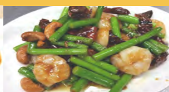
615 海老の唐辛子炒め