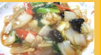
654 あんかけ焼きそば