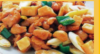
627 鶏肉カシューナッツ