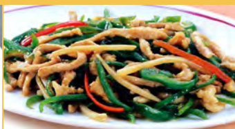
638 チンジャオロース