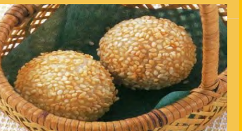
672 ごま団子 (1個)