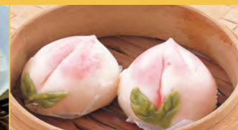
652 桃まん (1個)