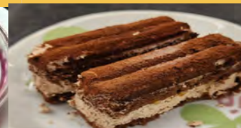
666 チョコレートケーキ