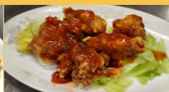
631 鶏の唐揚げサルソース