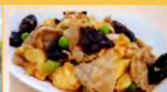
634 豚肉キクラゲ卵炒め