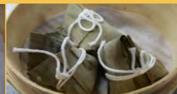
648 ミニちまき (1個)