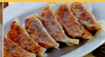
651 焼き餃子 (一皿6個)