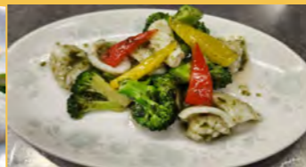
622 イカの青のり炒め