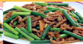
639 豚肉黒コショウ炒め