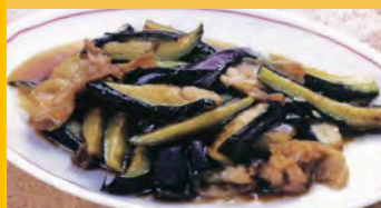
610 茄子オイスター炒め