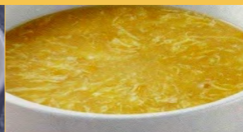
642 コーンスープ (2~3人前)