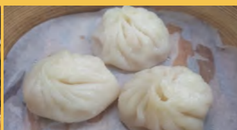
647 小籠包 (1個)