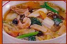
あんかけラーメン