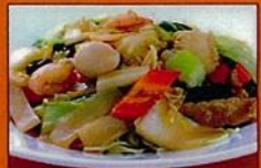
あんかけ焼きそば