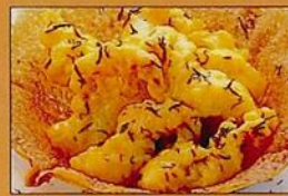
大海老のマヨネーズ