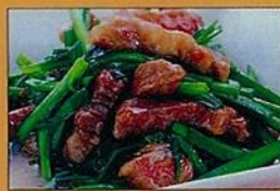
あっさりニラと塩牛カルビ