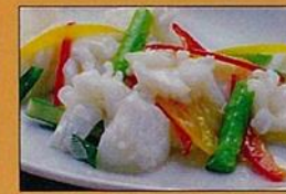
イカと季節野菜の塩炒め