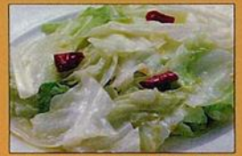
シャキシャキ国産キャベツのちよい辛炒め