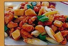
鶏とカシューナッツ