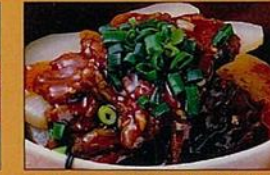
牛肉とじゃが芋のピリ辛炒め