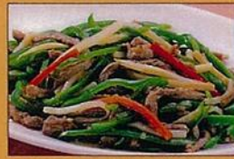
牛肉のチンジャオロース