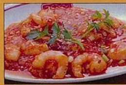
小海老の子リソース