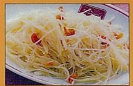
じゃが芋のシャキシャキ温サラダ