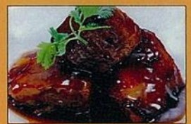
角煮の黒酢すぶた