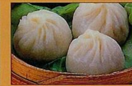
シヨロンポー(1人1個)