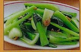
青菜のシャキシャキ炒め