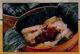
笹の葉ちまき(1人1個)