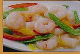
海老の自然塩炒め