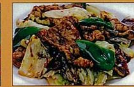
キャベツホイコーロー