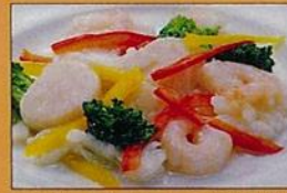
海老イカ帆立の塩炒め