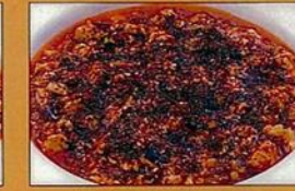
激辛マーボー豆腐