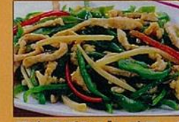
豚肉のチンジャオロース