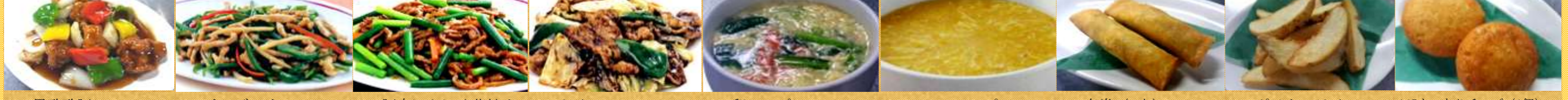
637黒酢酢豚 638チンジャオロース 639豚肉にんにく茎炒め 640ホイコーロ 641卵スープ 642コーンスープ 643春巻 (1本) 644ポテトフライ 645もちりチーズ (1個)