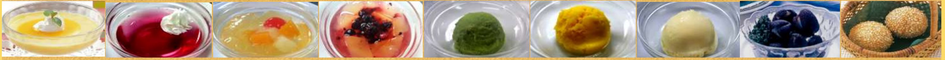
664マンゴープリン 665ぶどうゼリー 666れもんゼリー 667ラズベリーゼリー 668抹茶アイス 669シャーベット 670バニラアイス 671ライチ (5個) 672ごま団子 (1個)