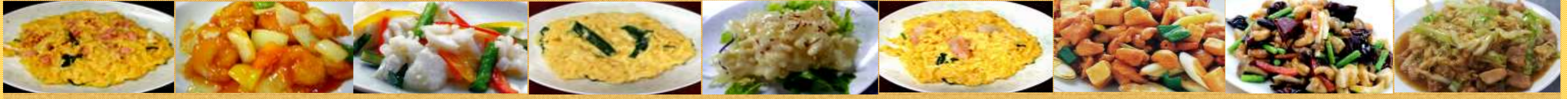
619かに玉 620エビ甘酢炒め 621イカ塩炒め 622ニラ玉 623イカマヨ 624エビ玉 625鶏肉のカシューナッツ 626鶏肉の唐辛子炒め 627鶏肉の親子炒め