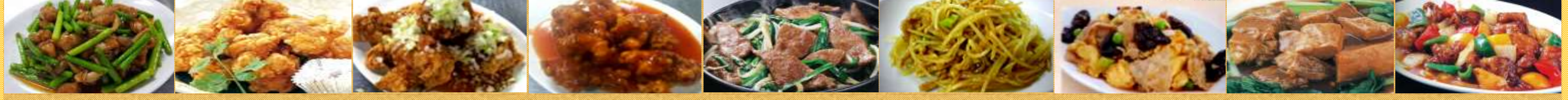
628鶏肉の台湾風炒め 629鶏の唐揚げ 630鶏の唐揚げネギソース 631鶏の唐揚げ甘酢ソース 632レバニラ炒め 633豚肉とジャガイモの炒め 634豚肉キクラゲ卵炒め 635豚角煮 636酢豚