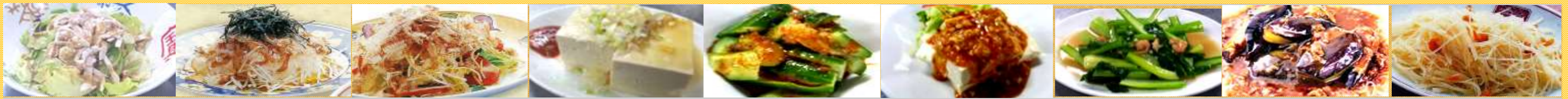
601バンバンチーサラダ 602大根サラダ 603カリカリサラダ 604冷やっこ 605きゅうりキムチ風 606ごまだれ豆腐 607青菜の塩炒め 608マーボーナス 609ジャガイモ炒め