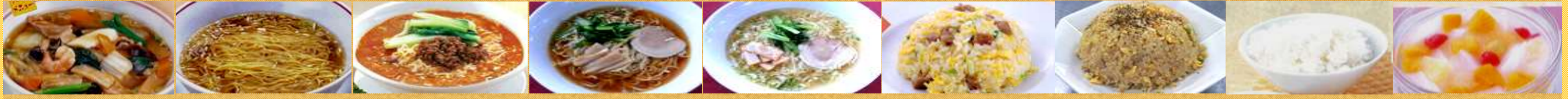
655あんかけラーメン 656ハーフラーメン 657担々麺 658醤油ラーメン 659塩ラーメン 660炒飯 661ガーリック炒飯 662ライス 663杏仁豆腐