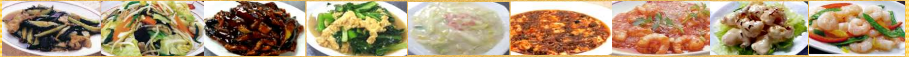
610茄子オイスター炒め 611野菜炒め 612茄子の甘味噌炒め 613卵と小松菜の塩炒め 614白菜のクリーム煮 615マーボー豆腐 616エビチリ 617エビマヨ 618エビ塩炒め