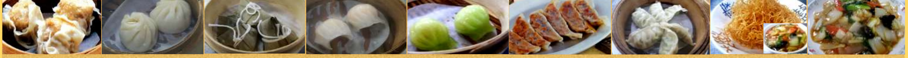
646焼売 (1個) 647小籠包 (1個) 648ミニちまき (1個) 649エビ蒸し餃子 (1個) 650ひすい餃子 (1個) 651焼き餃子 (6個) 652蒸し餃子 (6個) 653かた焼きそば 654あんかけ焼きそば